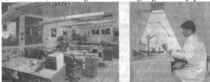
Tish texnigi ish joyi, laboratoriya.

Tish protezi tayyorlashda xamma ish jarayonlari qulay, tez va unumli bajarishga maxsus jixozlangan shaxsiy ishlash joyi, o'lchovlari 1,0x0,7m bo'lgan tish texnigi stoli imkoniyat tug'diradi. Stol tepasida yarim aylana o'yiqlik yuzasi bo'lib, zanglamaydigan po'lat yoki parchali latun bilan stol cheti ximoyalaniadi. O'yiqlik o'rtasida stol ustki taxtasi chetiga taxtadan bo'rtiq maxkamlanadi. Stol yuzasi ustida yoritgich anjomi, shlifmotor, elektr isitgich asbobi va gaz gorelkasi joylashtiriladi.